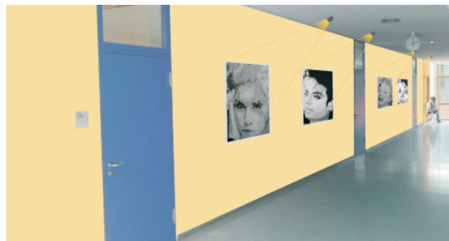
Eine Etage in sanfter Farbigkeit, dazu Schülerkunst.