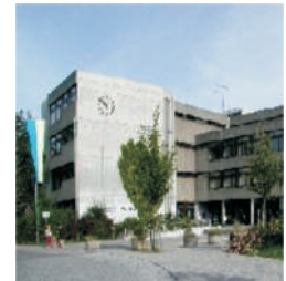
So sieht es oft leider nicht aus...

Das Votum auf der Elternbeiratssitzung war eindeutig: Es ist genügend oft freundlich darauf hingewiesen worden, jetzt muss seitens Polizei und Ordnungsamt aufgepasst werden. Dies passiert nun auch seit Kurzem, rücksichtsvollerweise wurden zunächst nur Verwarnungen und keine Geldbußen verhängt. Das jedoch kommt nun im nächsten Schritt. Erfreulicherweise hat sich die Situation nun etwas , aber noch nicht nachhaltig entspannt.