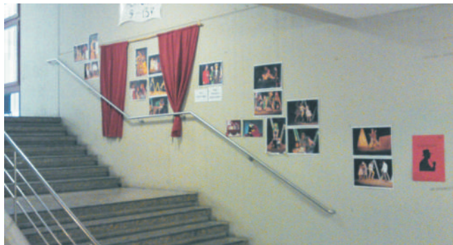
Das zentrale Treppenhaus derzeit.