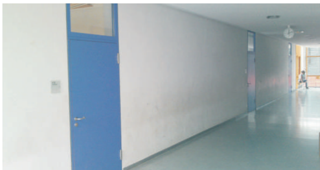
Ein Flur im Erweiterungsbau, derzeit. Und so soll es werden: